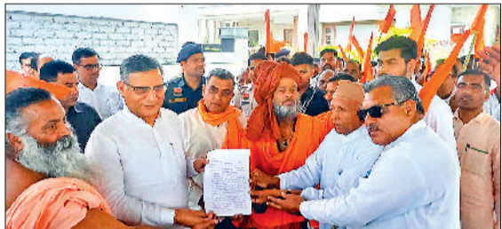
यमुनानगर के जगधरी में कृषि मंत्री को ज्ञापन सौंपते हुए व प्रदर्शन करते हुए हिंदू संगठनों के सदस्य।

वीरवार सुबह विश्व हिंदू परिषद के नेतृत्व में जिला भर के हिंदू संगठनों के हजारों सदस्य जिला सचिवालय के समक्ष एकत्र हो गए और प्रदर्शन करने लगे। इस दौरान हिंदू संगठनों के सदस्यों ने प्रदेश के राज्यपाल के नाम उपायुक्त को ज्ञापन सौंपा। इसके बाद हिंदू