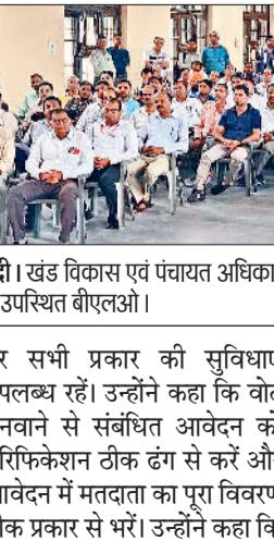
इंद्री। खंड विकास एवं पंचायत अधिकारी कार्यालय के सभागार में आयोजित बैठक में उपस्थित बीएलओ।