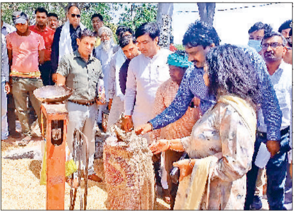
तरावड़ी। गेहूं के कटटे का तेल चैक करते हुये।