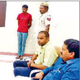
करनाल। लोक अदालत के दौरान मुख्य दंडाधिकारी सुश्री जसबीर।

जिला कारागार में मुख्य दंडाधिकारी एवं सचिव, जिला विधिक सेवाएं प्राधिकरण सुश्री जसबीर कौर द्वारा लोक अदालत का आयोजन किया गया। जिसमें 4 अंडर ट्रायल केसों में 1 अंडरगोन किया। सुश्री जसबीर ने बताया कि समय-समय पर जिला विधिक सेवाएं प्राधिकरण करनाल के द्वारा हर माह के पहले और तीसरे बुधवार को जेल में लोक अदालत का आयोजन किया जाता है। जसबीर कौर ने कैदियों से आग्रह किया कि अगर किसी के पास