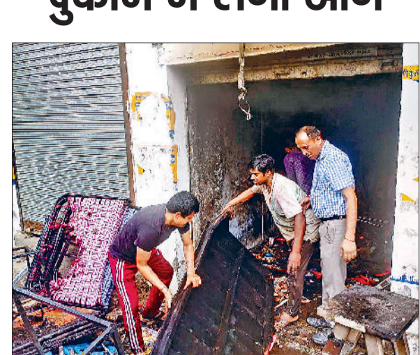
कुरुक्षेत्र। आग में जला सामान।

स्टोर व शोरूम में रखी प्लास्टिक की कुर्सियां, फोल्डिंग की निवार सहित प्लास्टिक का अन्य सामान जल गया। दुकान मालिक ने बताया कि अभी नुकसान का अनुमान नहीं है। दुकानदार ने आरोप लगाया कि दुकान के शटर के पास कूड़ा पड़ा हुआ था जिससे किसी ने आग लगा दी जिससे दुकान में आग लग गई। फायर ब्रिगेड की गाड़ी ने मौके पर पहुंचकर आग बुझाई।